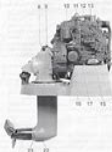
M1000 with 1000-ohm