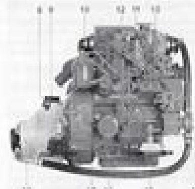
M1000 with reverse gear M100-L