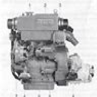
M1000 with reverse gear M100-L