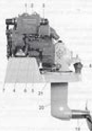
M1000 with 1000-ohm