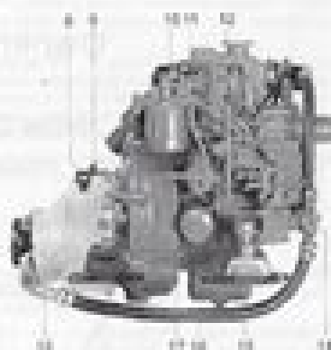
M1000 with reverse gear M100-L