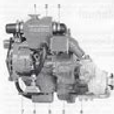
M1000 with reverse gear M100-R