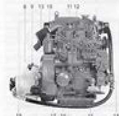
M1000 with reverse gear M100-L