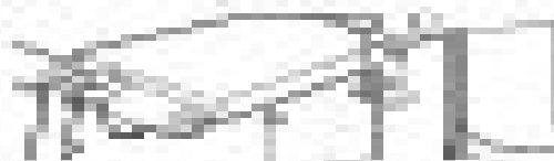
1. Side View (Adjustable Arm)

For information, contact us for specifications, technical drawings.